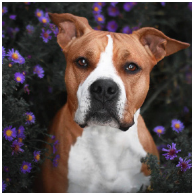
American Stafforshire Terrier

* Type = chien qui n'est pas de race, et non inscrit à un livre des origines françaises ou FCI